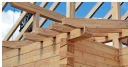
Die Lindt-Blockwand ist besser als es die aktuelle EnEV verlangt.

Die Lindt Fertig & Blockhaus GmbH präsentiert eine der besten Blockhauskonstruktionen mit atmungsaktiver Wandkonstruktion. Bei diesem System besteht die tragende Blockwand aus 220 mm starken Leimholz-Vierkantbohlen (nordische Kiefer). Um die strengen Anforderungen der aktuellen EnEV einzuhalten, werden die Außenwände zusätzlich gedämmt – wirtschaftlich und ökologisch mit neuen, patentierten ISO-Balken, die mit Perlite-Dämmung von Fermacell gefüllt sind. So entsteht ein echtes Energiesparhaus mit atmungsaktiver